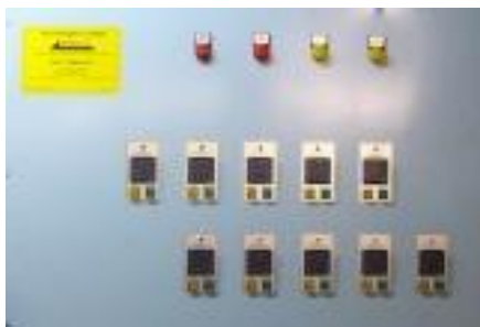
Стандарт (регуляторы FUJI)