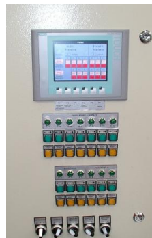
GT-easy (система SIEMENS SIMATIC)